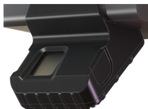
Сканер отпечатка пальца