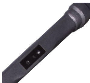
Сканер ШК 1D/2D