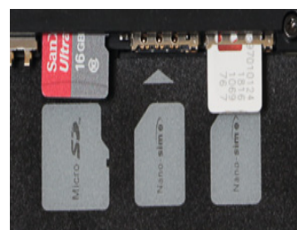
S6Pro: больше памяти и производительность процессора