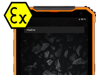
Искробезопасное исполнение: зона 1 и 2