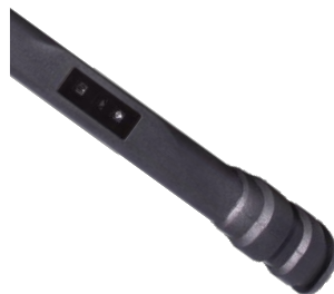
Сканер ШК 1D/2D