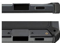
2D сканер штрих-кодов