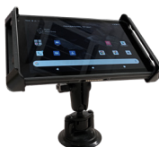
Держатель для крепления в транспортном средстве