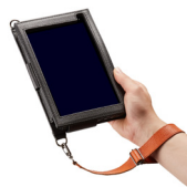
Аксессуары для удобства использования